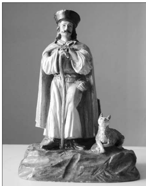
Augustin Klose z Králík, Pastýř se psem, 2. pol. 19. st., v. 21 cm, snímek MM Králíky.