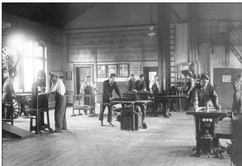
Školní dílna dřevařské školy v Chrudimi, SOKA Chrudim, inv. čís. 627.