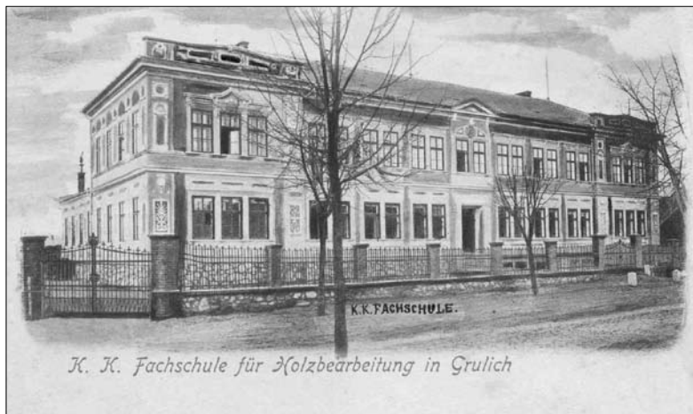
Budova bývalé odborné školy v Králíkách, snímek z roku 1910, MM Králíky.