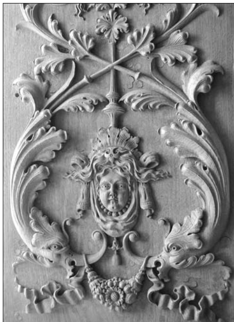
Reliéfní řezba, žákovská práce odborné školy v Králíkách, 1. pol. 20. st.