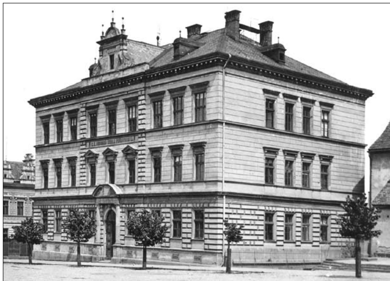
Budova bývalé dřevařské školy v Chrudimi, snímek z roku 1946, SOKA Chrudim, inv. čís. 627.