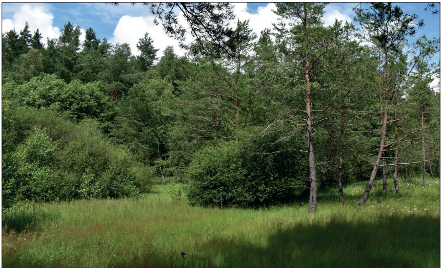
Obr. 3: Rašeliniště Na Tintěrkách hostí vzácnější druhy pavouků jako např. Hahnia helveola , Heliophanus dampfi a Notioscopus sarcinatus .

Fig. 2: Sandstone rocks in Maštale, habitat of typical rock species Leptyphantus leprosus , Meta menardi , Nesticus cellulanus and Leiobunum rupestre .