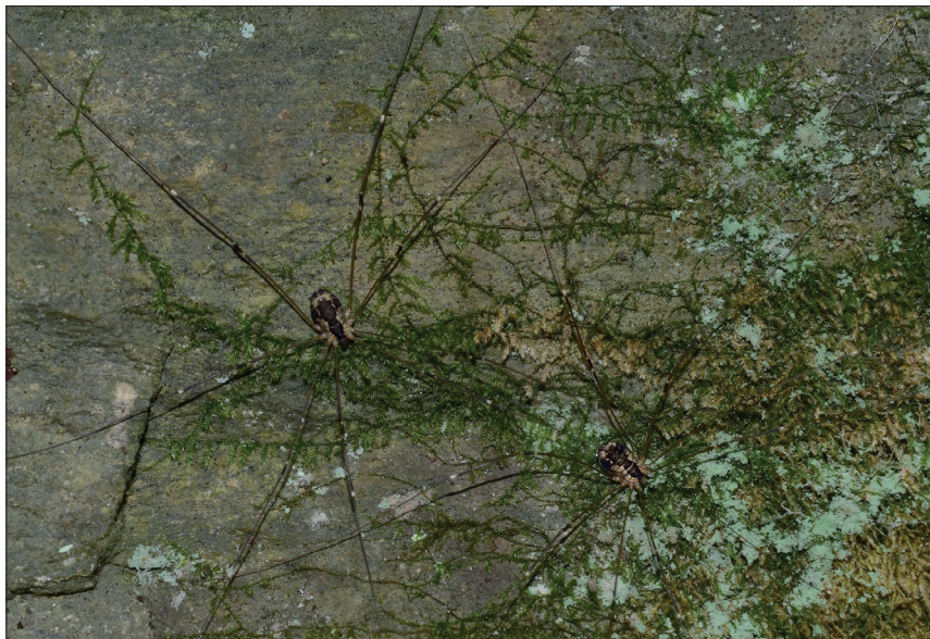
Obr. 5: Leiobunum rupestre , typický druh pískovcových skal v PR Maštale.

Vzácnější druh, vázaný na přirozené stanoviště jako jsou reliktní bory, vřesoviště, okraje rašelinišť, žije na zemi v listovém opadu. Vzácně, ale roztroušeně, zvláště v nižších