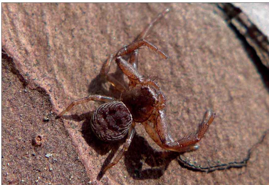
Obr. 4: Coriarachne depressa , typický druh kmenů borovic v PR Maštale.