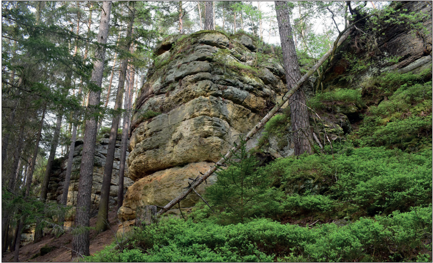
Obr. 2: Pískovcové skalní útvary v PR Maštale, obývají typické skalní druhy pavouků jako např. Meta menardi , Nesticus cellulanus nebo Leptyphantus leprosus a sekáč Leiobunum rupestre .

Fig. 2: Sandstone rocks in Maštale, habitat of typical rock species Leptyphantus leprosus , Meta menardi , Nesticus cellulanus and Leiobunum rupestre .